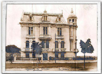
En el corazón de la Cidade Maravilhosa , Registro Histórico de 1919 del edificio que ocupaba, en Río de Janeiro, la Legación de Chile en Brasil.

Más de 40 mil piezas, entre negativos y copias, conforman el Archivo General Histórico de esta dependencia gubernamental. El material está disponible para consulta en una plataforma especial en internet.