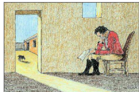
Detalle de otro dibujo. "Está leyendo en una carta que mataron a sus dos hermanos en Mendoza", apunta el artista.